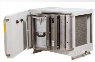
Absauggerät LTA AC3001