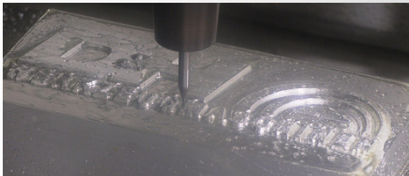
Fräsen in Aluminium

Stets stehen Hohe Oberflächenqualität, gute Zerspanungsleistung aber auch die Rüst-freundlichkeit und der Automatisierungsgrad im Vordergrund einer Maschinenbetrachtung.