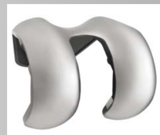
3D Schleifen eines Implantates