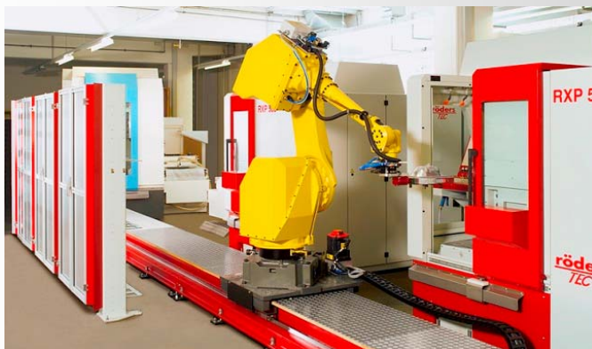
Roboter bedient mehrere HSC- Maschinen

Genauso wichtig wie eine zuverlässige Werkzeugmaschine ist die Auswahl des richtigen Zubehörs. Werkstückreinigung, Kennzeichnung und Automatisierung sind heute unumgänglich und Stand der Technik in einer modernen Fertigung.