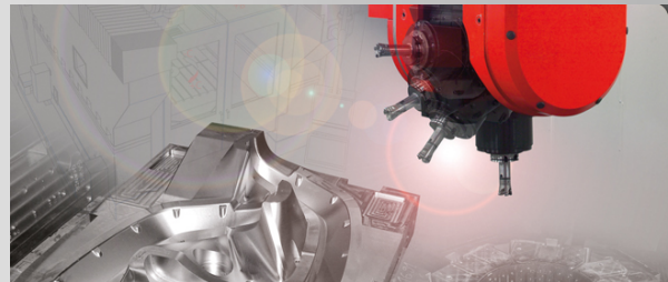
HSC 5 Achsfräsen im Großformenbau