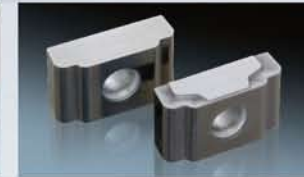
3D Lasergravur der Spanleitstufe auf einer Wendschneidplatte.