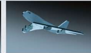
Laserfeinschneiden von Metall. Das Material (0,6 mm) wird so exakt geschnitten, dass die Einzelteile ohne zusätzliches Bearbeiten oder Kleben zusammen gesteckt werden können.