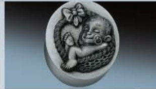
3D Lasergravur eines Prägestempels.