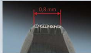
Lasermikrogravur von Punzierungsstempeln.