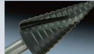
3-Achsbearbeitung. Gelaserte Skalierung mit „Drall“ auf einem gedrehten Stufenbohrer.