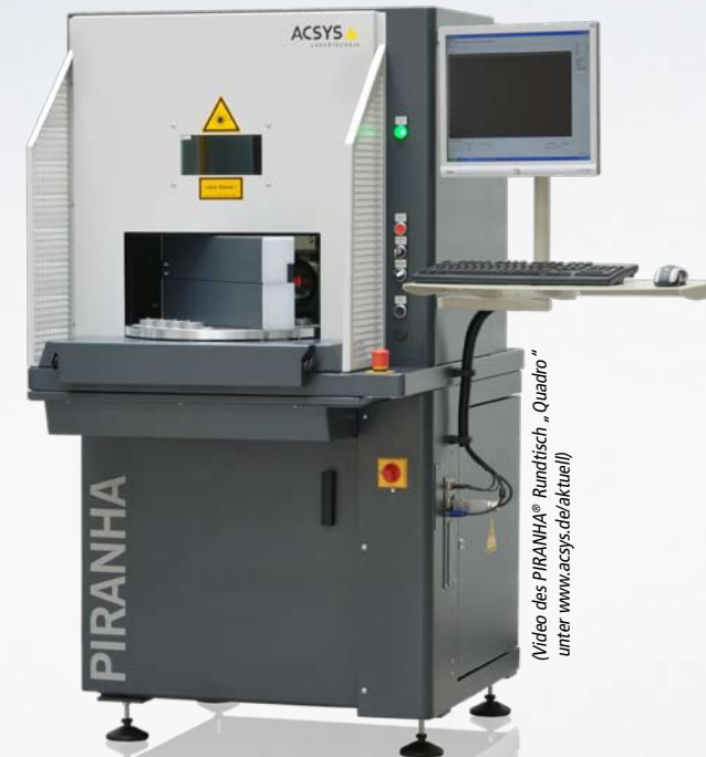
(Video des PIRANHA® Rundtisch „Quadro“ unter www.acsys.de/aktuell )

Beispiel einer kundenspezifischen Lösung von ACSYS: